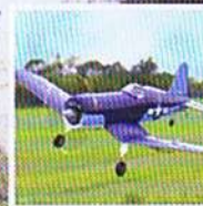
Page des jeunes