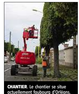
CHANTIER. Le chantier se situe actuellement faubourg d'Orléans.

Le chantier, exécuté par l'entreprise L'Éden vert, de Vicq (Yvelines), va ensuite concerner le centre-ville. ■