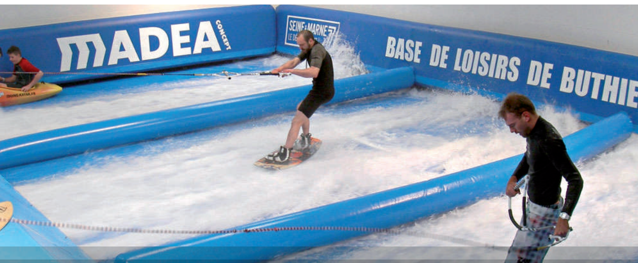
Le simulateur modulable, à Buthiers, peut accueillir jusqu'à 3 personnes d'âge et de niveau différents.