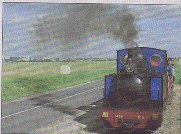
Trois rames historiques font les rotations de Pithiviers jusqu'au bois de Bellébat.

Les bénévoles de l'association ont sauvé des locomotives, autorails, wagons et voitures, dont onze sont