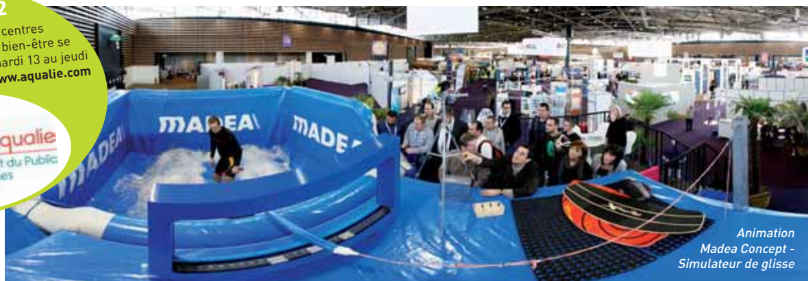
Animation Madea Concept - Simulateur de glisse

14 e Congrès Aqualie des Piscines Recevant du Public et des Loisirs Aquatiques