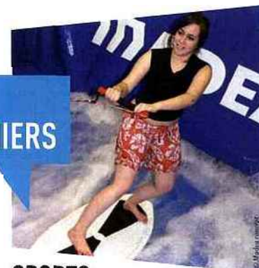
SPORTS DE GLISSE EN INTÉRIEUR, À LA BASE DE LOISIRS DE BUTHIERS

MADEA CONCEPT , entreprise de 5 salariés créée en 2009 et implantée au sein du pôle d'activités de Melun-Villaroche, vient d'être choisie pour équiper la base de loisirs de Buthiers d'un simulateur multisports de glisse, première infrastructure de ce type en France, faisant du site seine-et-marnais la plus grande zone de glisse couverte au monde (96 m 2 ).