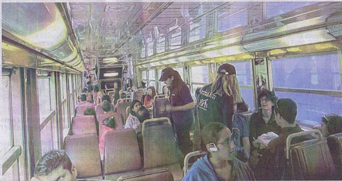
VERSAILLES, HIER MATIN. Environ 50 000 touristes par jour circulent sur la ligne C du RER en direction du château. Pendant la période estivale, des hôtesse viennent à leur rencontre.

Deux autres rames décorées d'ici à la fin août