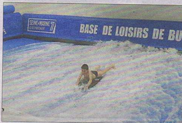
Les enfants se jettent dans la vague l'un après l'autre.

Ouvert toute l'année, sur réservation de séances encadrées par un moniteur diplômé, il complète le pôle sportif composé de la salle de fitness et de la salle d'escalade et s'adresse aux adultes débutants ou confirmés et aux enfants à partir de 6 ans. Le contrôle de la largeur et de la force de la vague permet